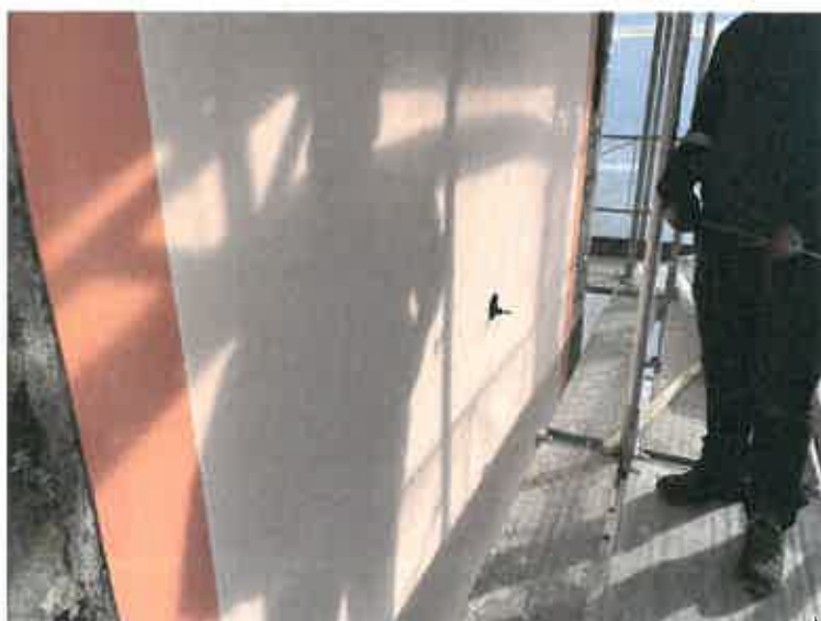
L'impresa di pittura ha dapprima consolidato il fondo, applicato un nuovo intonaco fine a base minerale, e da ultimo ha proceduto al tinteggio

Da parte della cittadinanza vi sono state dimostrazioni di soddisfazione per i risultati ottenuti. Inoltre sono giunti anche degli auspici affinché l'opera venisse completata con un'illuminazione adeguata, sulla scorta di quanto già intrapreso a Verscio e Tegna.