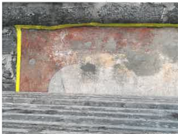
L'impresa di costruzioni ha rimosso tutto il vecchio Marmoran.