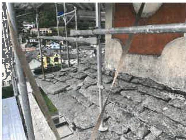
Foto situazione iniziale, prima della pulizia del fondo

Il ritinteggio deve avvenire su un fondo adeguato che va pulito, eliminando le impurità, per poi essere stuccato, lisciato, e preparato.